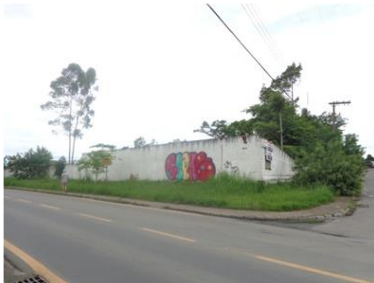
Imagem 01 – Vista frontal do imóvel.

Obra localizada na Rua Imigrante Meller esquina com Rua dos Rogacionistas, Bairro Santa Augusta - Criciúma-SC;