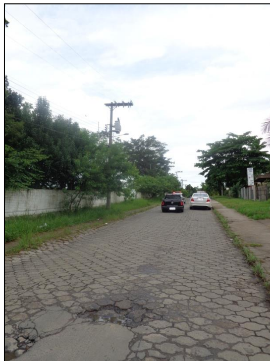
Imagens 02 e 03 – Rua Imigrante Meller e Rua dos Rogacionistas confrontantes com o Condomínio Residencial Rogacionistas.