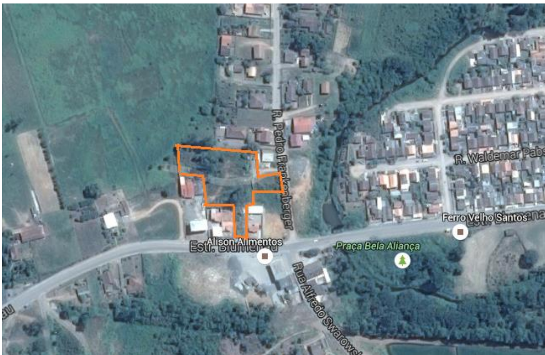
Localização do imóvel periciado por foto por satélite