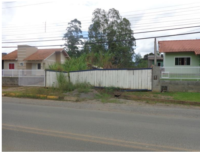
Imagem 01 – Vista frontal do imóvel.

Obra localizada na Rua Pedro Frankenberger, Bairro Bela Aliança, Rio do Sul-SC;